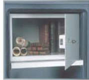
Equipements intérieurs (en partant de la gauche) : tablette, armoire à clé